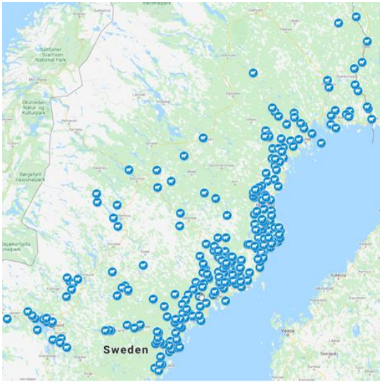
Bild 1. Gårdar som levererar mjölk till Norrmejerier 16