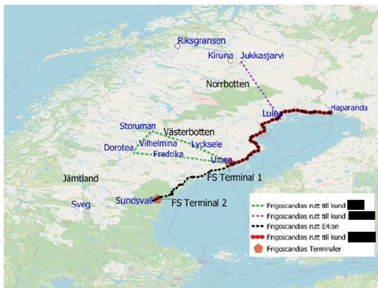
Bild 8. Översikt av sträckor inom Norrmejeriers invägningssområde trafikerade av Frigoscandia under perioder av Samarbetsavtalet 206