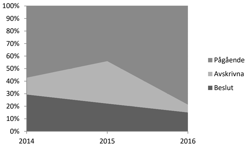
Diagram 3 Andel av den totala utredningstiden per år som lagts på ärenden som pågår, har skrivits av eller avslutats genom ändrat beteende, åtagande, åläggande, avgiftsföreläggande eller ansökan om stämning

För år 2016 uppgår andelen av vår tid som lagts på ärenden med sådana avslut till 15 procent och året innan till 22 procent när även tid som lagts på pågående utredningar beaktas.